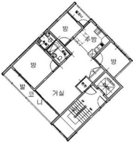
501호 공부상 면적 : 72.99㎡