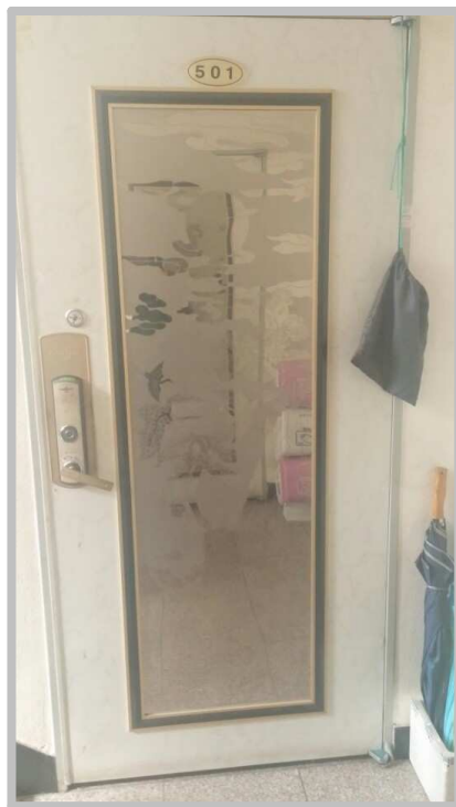
【 본건 출입구 】