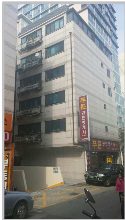
【 본건물 전경 】