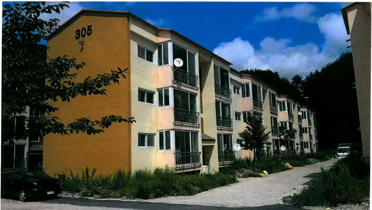
본 건 전 경