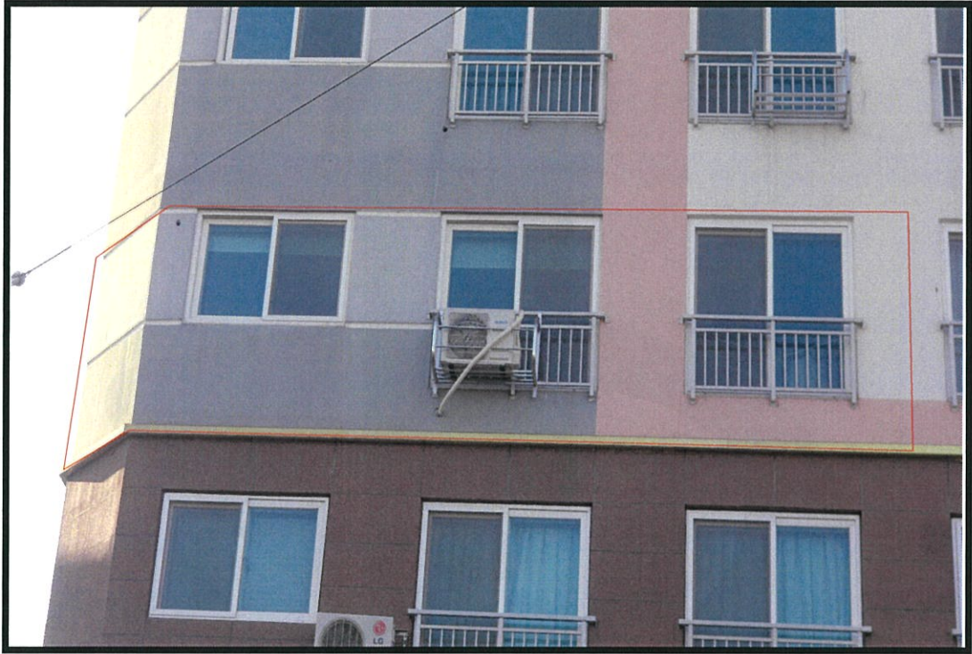
【본건(파스텔해비치 제3층 제302호)】