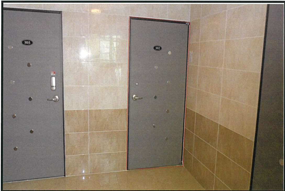
【본건(파스텔해비치 제3층 제302호)】