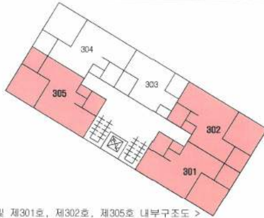
< 썬사인시티빌 제3층 호별배치도 및 제301호, 제302호, 제305호 내부구조도 >