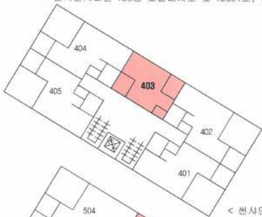
< 썬사인시티빌 제4층 호별배치도 및 제403호 내부구조도 >