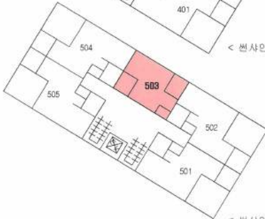
< 썬사인시티빌 제5층 호별배치도 및 제503호 내부구조도 >