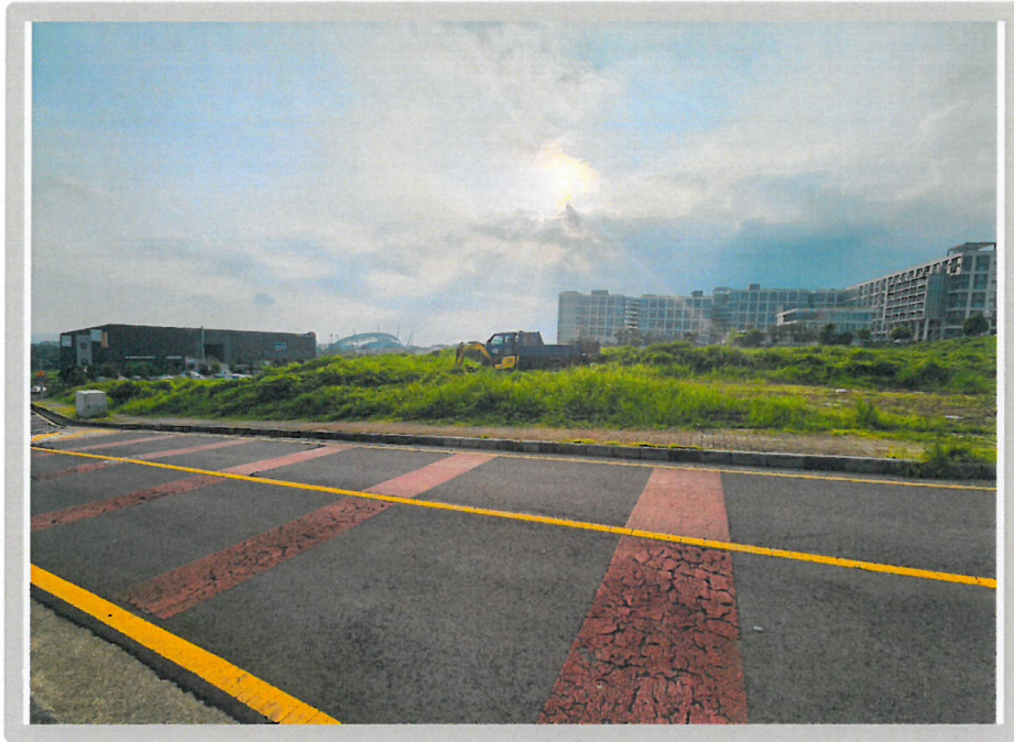
【 대상물건 전경 】