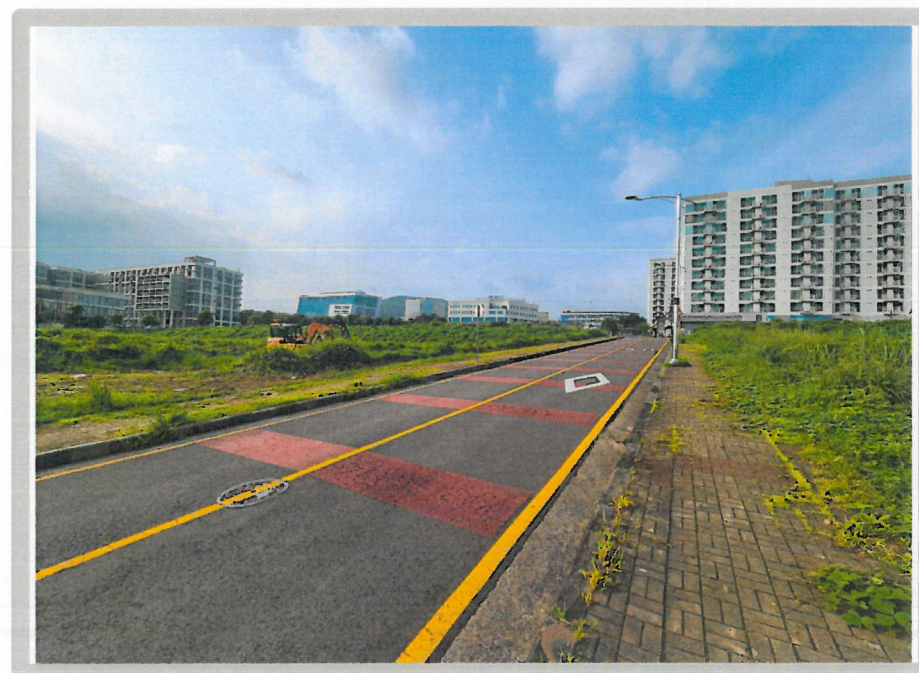
【 주위환경 】