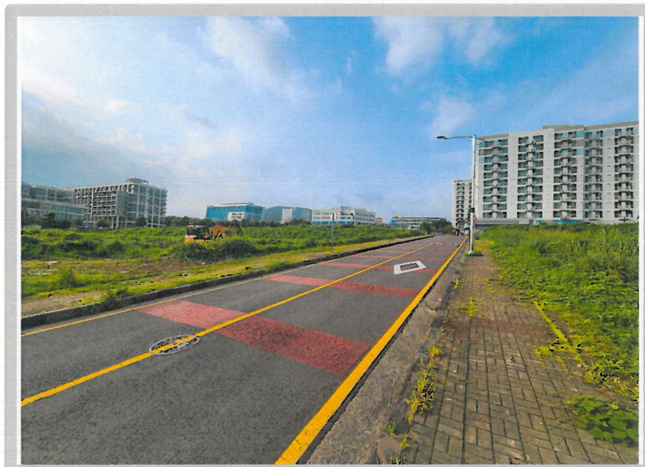
【 주위환경 】