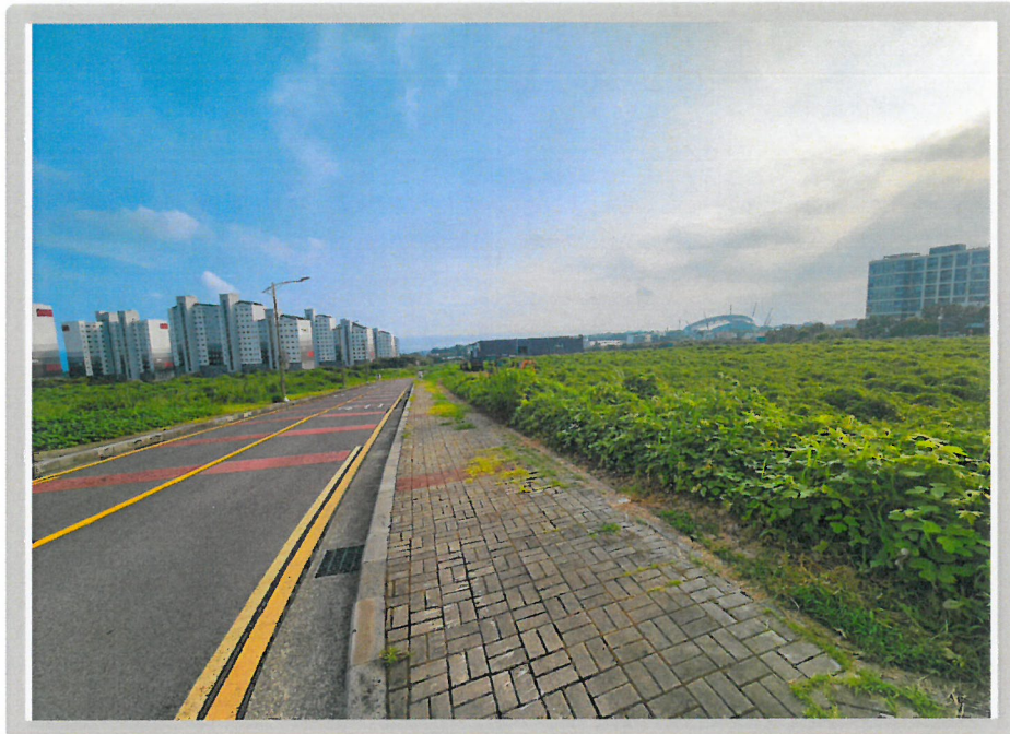
【 주위환경 】