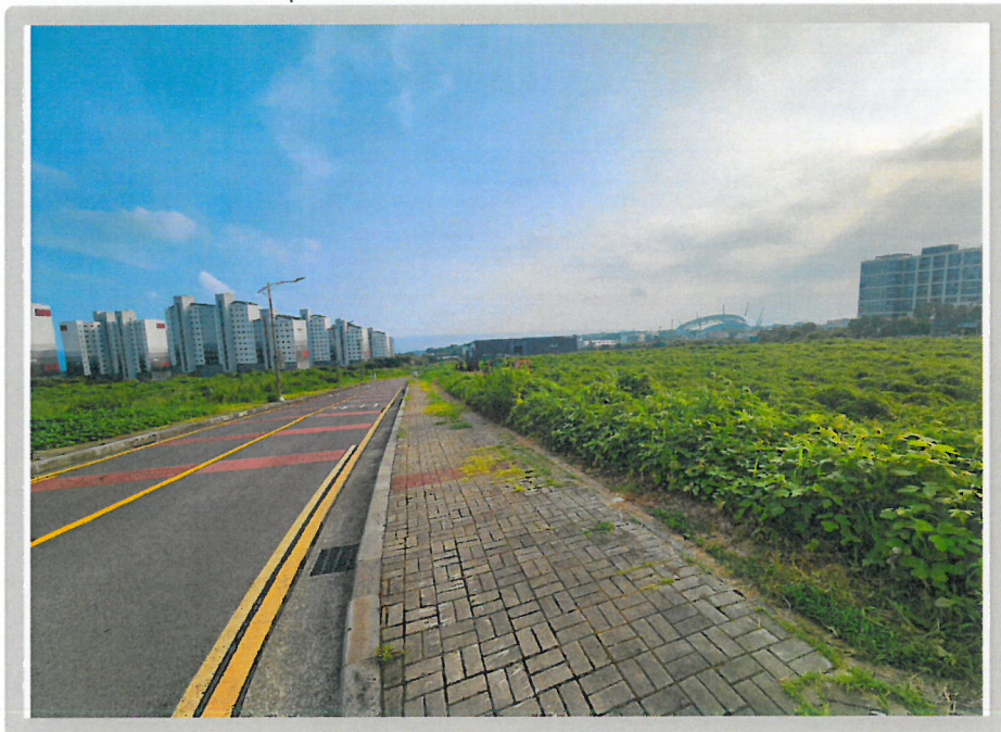
【 주위환경 】