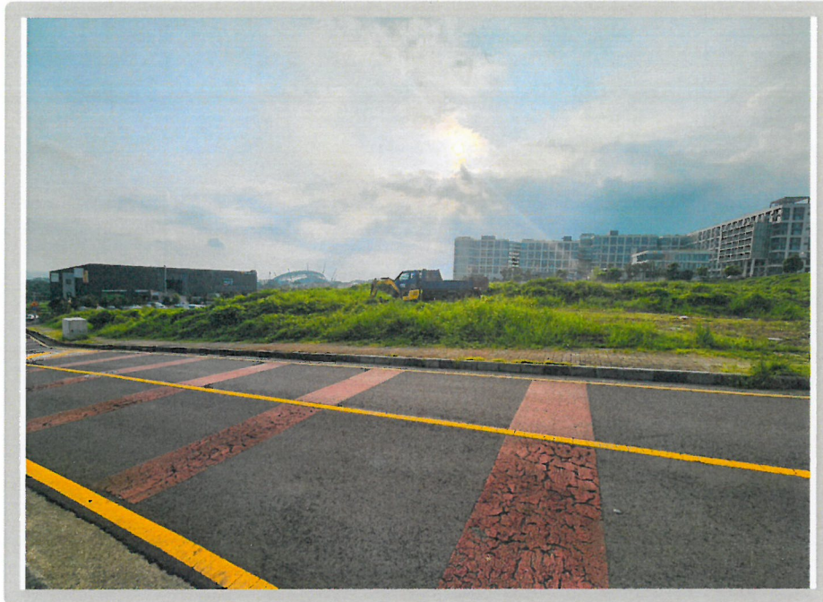
【 대상물건 전경 】